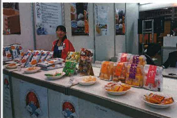
コメ・コメ加工品の展示③