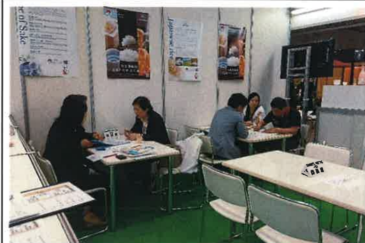
ミーティングスペース