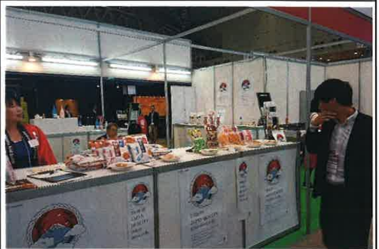
コメ・コメ加工品の展示②