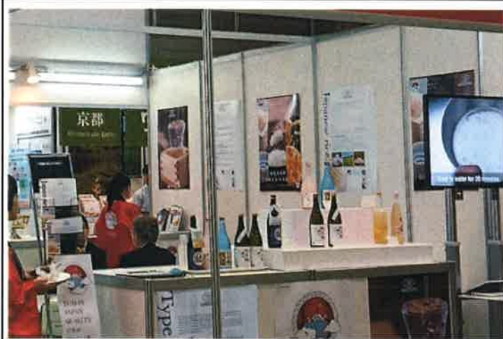
コメ・コメ加工品の展示①