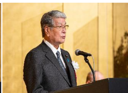
野村農林水産大臣