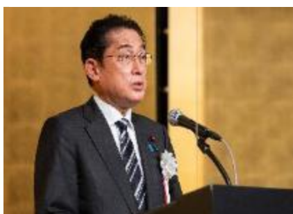
岸田総理大臣(当時)