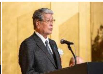
野村農林水産大臣(当時)